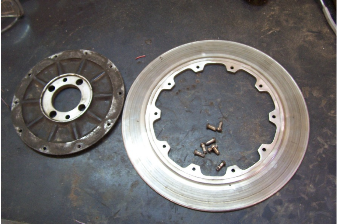
Y ya tenemos separadas las dos piezas